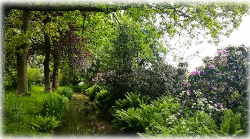
Zomer bij De Beek..