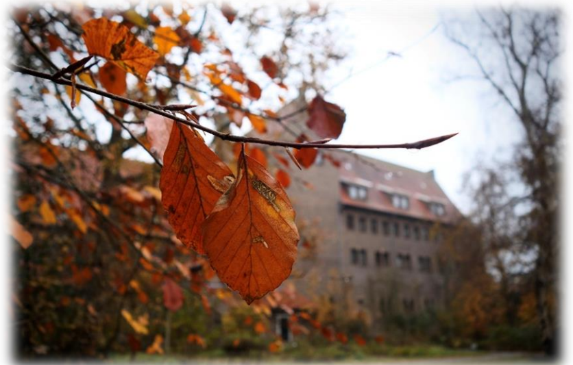
Herfst op de Parkweide